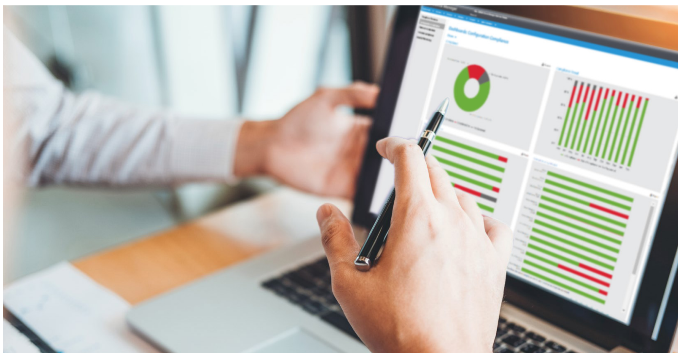
Service d'audit de la sécurité des imprimantes de Xerox

La sécurité intégrale couvre tous les aspects des services de gestion déléguée des impressions, notamment ses outils connectés et ses analyses, de sorte que vous pouvez être sûr d'être conforme et protégé. Une combinaison intégrée des éléments hébergés par le client sur site et par Xerox offre la flexibilité et la connectivité sans compromettre la sécurité.