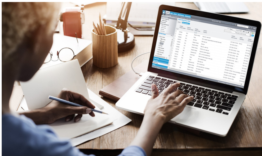
Gestionnaire des Services Xerox

Visibilité de toutes les activités liées aux incidents, feedback en boucle fermée, suivi de tous les appareils (y compris les appareils non Xerox) à tout moment et en tout lieu, gains de temps grâce au réapprovisionnement automatique en fournitures, suivi précis des ressources et optimisation du temps de fonctionnement des appareils pour une productivité maximale