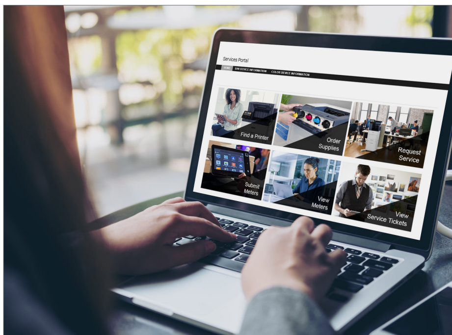
Portail des services Xerox